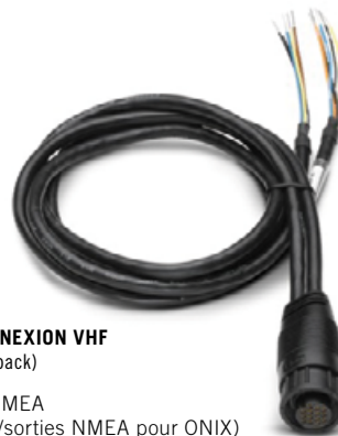
CÂBLE POUR CONNEXION VHF (non fourni dans le pack)

>réf. AS-DUALNMEA (Câble 2 entrées/sorties NMEA pour ONIX)